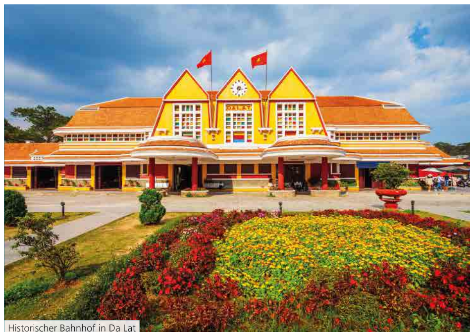
Historischer Bahnhof in Da Lat

(F=Frühstück, M=Mittagessen, A=Abendessen)